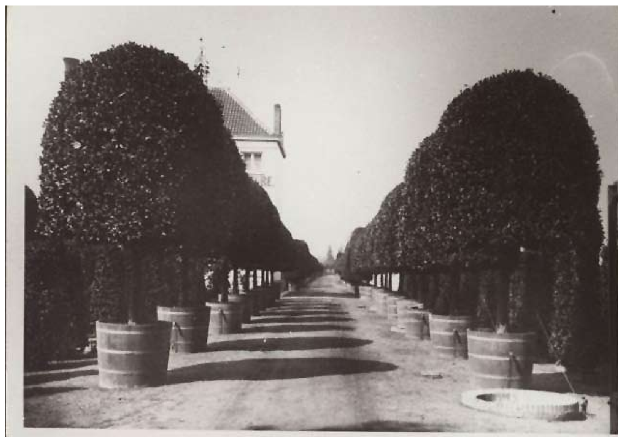
Indrukwekkende rij laurieren bij het bedrijf van Vincke-Dujardin.

Wanneer we ieder jaar onze belastingsbrieven in ontvangst nemen worden we node herinnerd aan het roemrijke verleden van horticultuur Vincke -Dujardin.